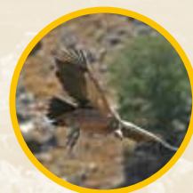
Buitre Leonado ( Gyps fulvu )