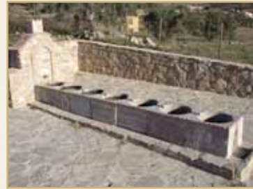
Nueva Fuente de la Torre

El sendero transcurre en los límites del Paraje Natural de El Torcal de Antequera, concretamente por el Torcal Bajo, zona que presenta menor atractivo en sus formaciones paisajísticas que el Torcal Alto, pero que nos muestra otros aspectos de gran interés, destacando el aprovechamiento humano que se ha realizado de esta zona a lo largo de la historia.