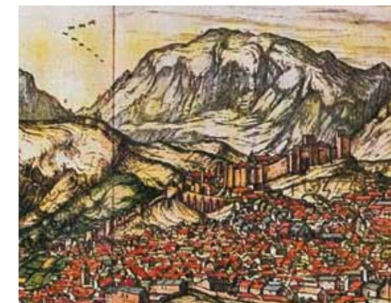
La Alcazaba de Antequera en un grabado dibujado por Hoefnagle en 1564 para el Civitates Orbis Terrarum .

11. Murallas de levante. Cierre oriental del recinto defensivo de la Alcazaba. Corresponde a época almohade (siglo XII) su fábrica de tapial, siendo forrada de mampostería de piedra en época nazarí.