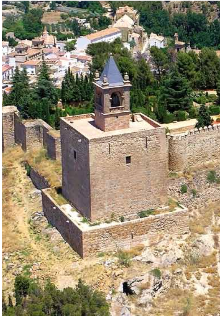
Foto aérea y planta de las diferentes salas de la torre del Homenaje de la Alcazaba.