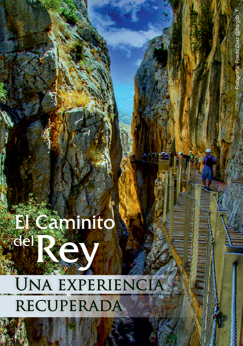
Fotografía: Pakito Diaz @franjob - 1