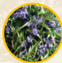
Lirios ( Iris xiphium )