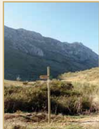
Señal en el Nacimiento de la Villa

El paisaje que encontraremos está constituido por formaciones de roca caliza como la cara norte de Las Vilaneras, una falla que separa el Torcal Bajo del Torcal Alto, donde anidan algunas rapaces; y la Sierra de Chimenea, coronada con el Camorro Alto (1.369 m), punto más alto de este paraje, donde hasta no hace