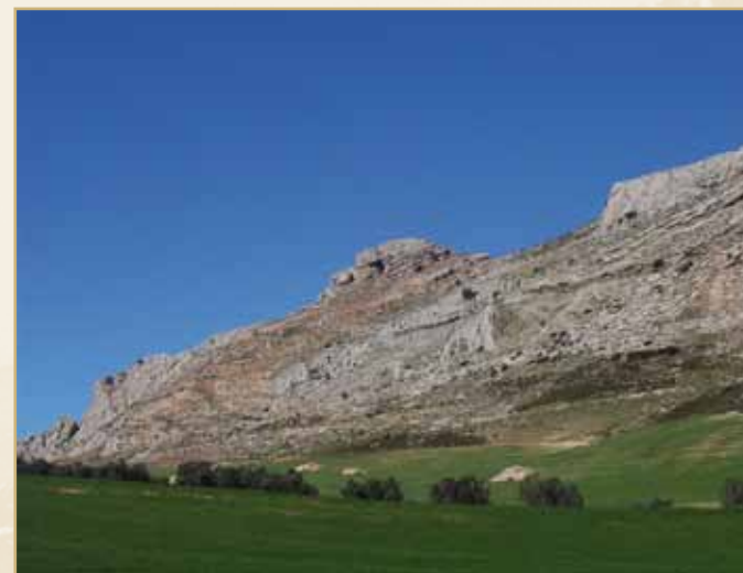
Vista de Sierra de la Chimenea