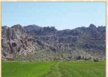
Paisaje kárstico de El Torcal desde Los Navazos

Finalizaremos nuestro sendero en el Área Recreativa del Nacimiento de la Villa, a los pies de Sierra Pelada, donde mana un manantial de abundante caudal, el arroyo de La Villa, origen de las filtraciones de los profundos hoyos y simas de El Torcal.