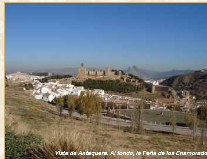
Vista de Antequera. Al fondo, la Peña de los Enamorados