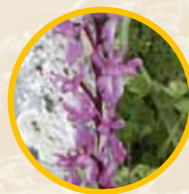
Orquídea ( Barlia robertiana )