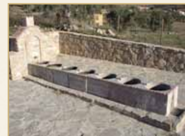
Nueva Fuente de la Torre

El sendero transcurre en los límites del Paraje Natural de El Torcal de Antequera, concretamente por el Torcal Bajo, zona que presenta menor atractivo en sus formaciones paisajísticas que el Torcal Alto, pero que nos muestra otros aspectos de gran interés, destacando el aprovechamiento humano que se ha realizado de esta zona a lo largo de la historia.