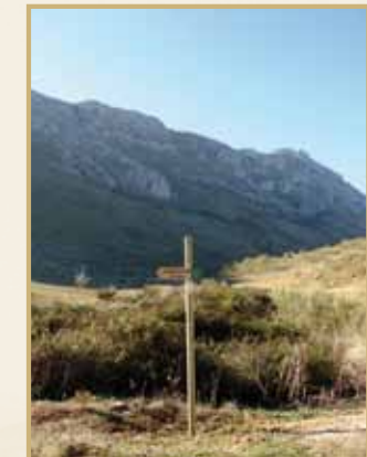
Señal en el Nacimiento de la Villa

El paisaje que encontraremos está constituido por formaciones de roca caliza como la cara norte de Las Vilaneras, una falla que separa el Torcal Bajo del Torcal Alto, donde anidan algunas rapaces; y la Sierra de Chimenea, coronada con el Camorro Alto (1.369 m), punto más alto de este paraje, donde hasta no hace