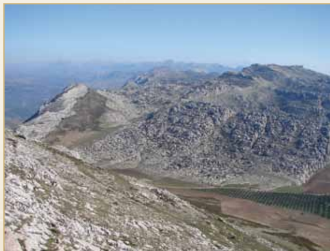
Vista desde el Camorro Alto. Camino en el Puerto de la Escaleruela