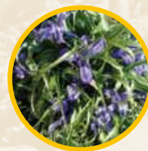
Lirios ( Iris xiphium )