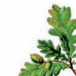
Roble o Quejigo