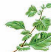
Espino Majuelo o Majoletto